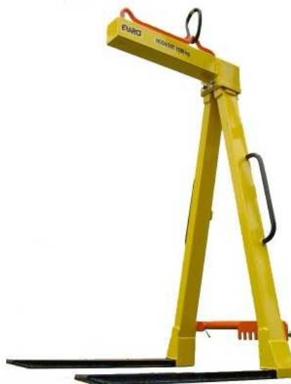
Pallet hook / Paletový hák