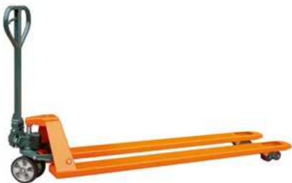
Pallet lifter / Paletový vozík

Všechny druhy balení je možno manipulovat pomocí paletového vozíku a paletového háku. Některé výše popsané balení je možno manipulovat i zavěšené na laněch jeřábem.