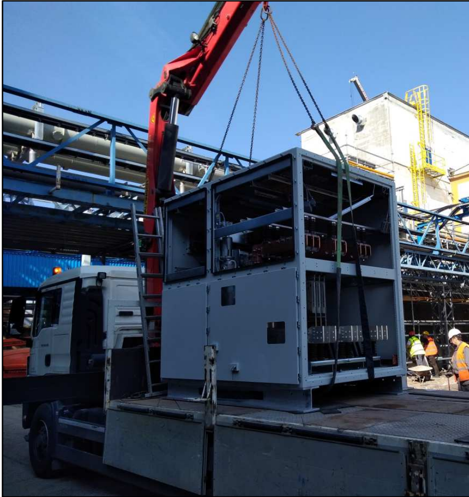
Lifting the switchgear cabinets by rope / Zvedání rozváděčů závěsem