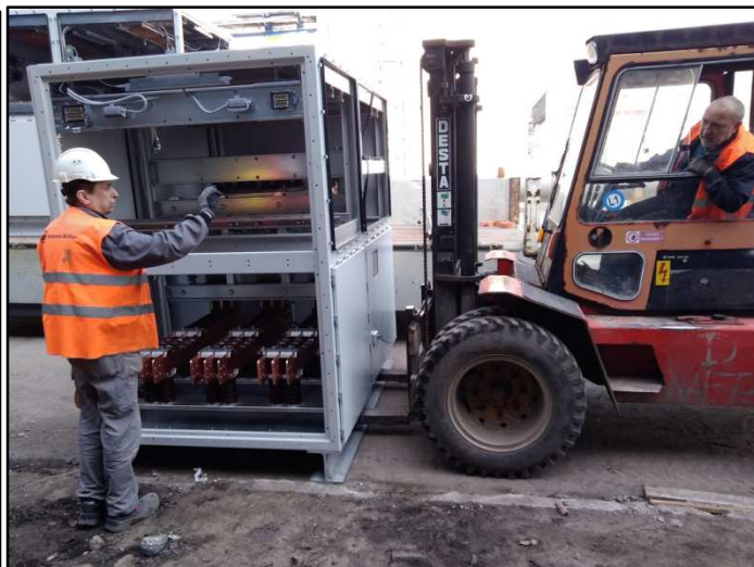
Examples of lashing and lifting the switchboard cabinets Příklady vázání a zvedání rozváděčů