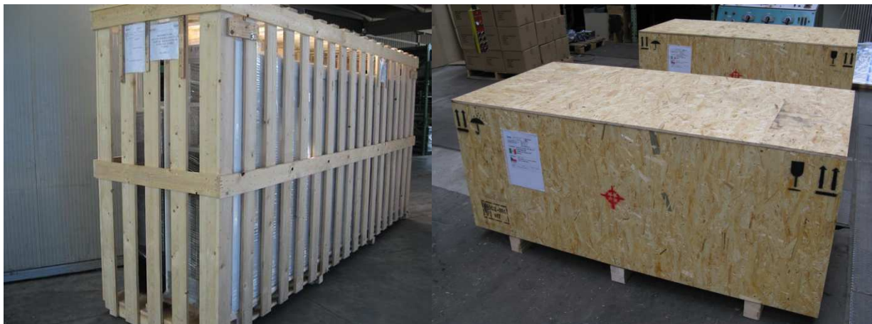
Wooden crate, wooden box Dřevěná klec, dřevěná bedna

Dle provedení, jsou rozváděcí skříně přepravovány na dřevěných paletách, případně přímo na jejich vlastních ocelových rámech, které se nedemontují. Rozváděcí skříně nejsou stohovatelné. Balení je provedeno pouze fólií, s vloženými ochrannými rohy. V některých případech, pro zámořské balení je použito dřevěné klece, případně bedny.